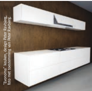
"Eronoma" keuken, design Peter Ruytjens, foto met toestemming van Peter Ruytjens.